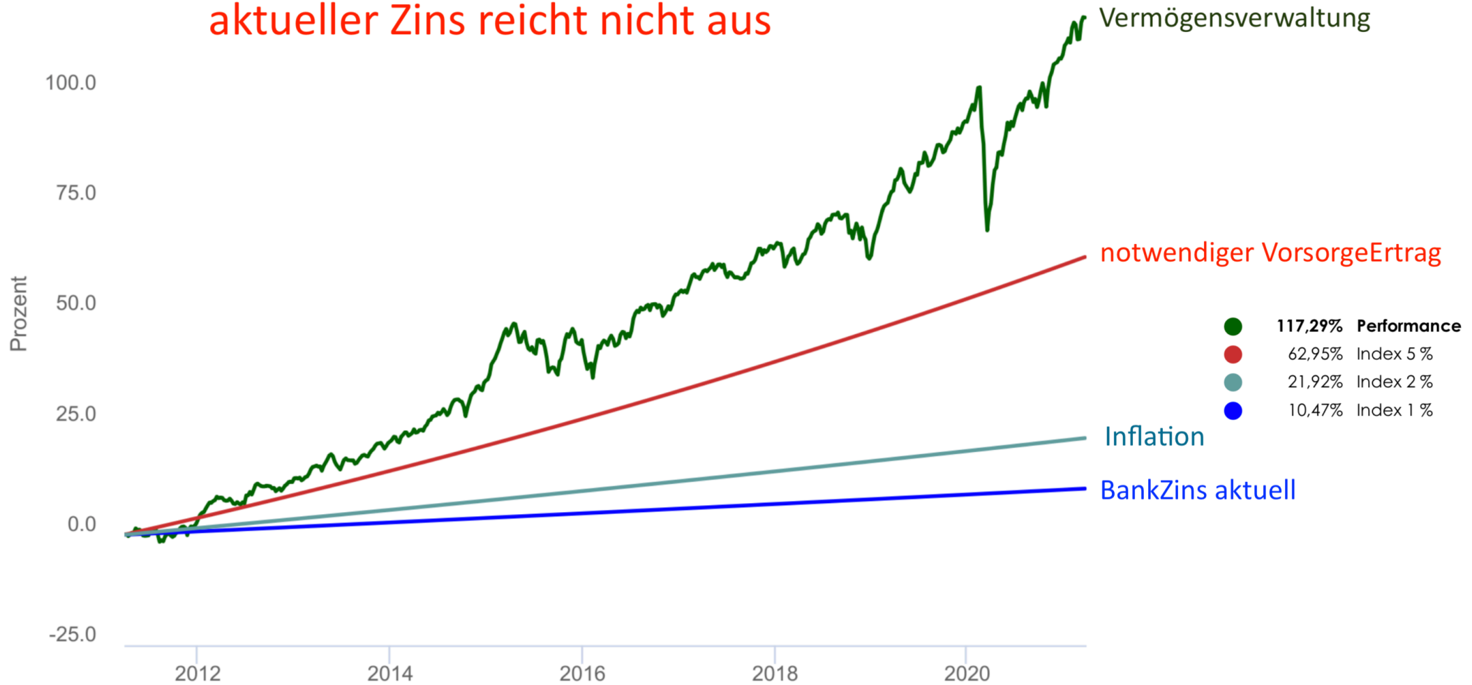
Illustration notwendige Vorsorge